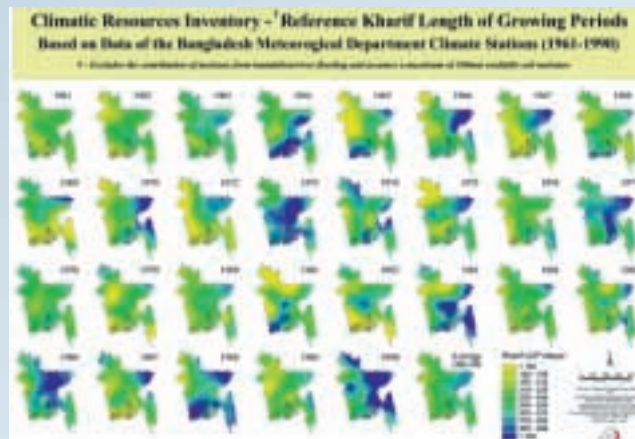
Suivi du climat au Bangladesh

Vous êtes invités à les contacter directement pour toute information liée au contenu des rapports régionaux/nationaux.