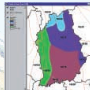
Carte de bassin versant dans un district au Bangladesh