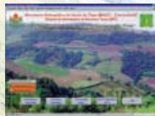
Planification de l'utilisation durable des terres au Brésil